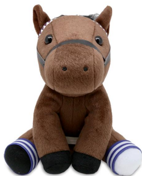
日本ダービー優勝馬 ワグネリアン ぬいぐるみ