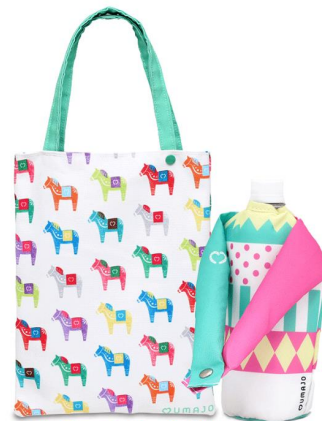
ダーラナトートバック & 勝負服風ペットボトルカバー