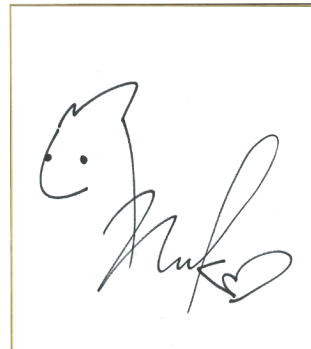
藤田菜七子 騎手 サイン色紙